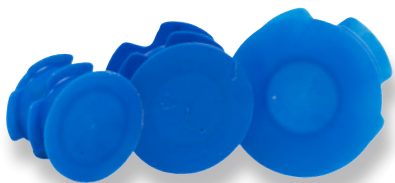
KABELFLEX ZANDDICHTE AANSLUITKAP EXCL. WARTEL